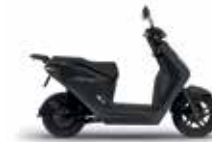
Mat Ballistic Black Metallic