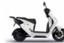
Pearl Sunbeam White