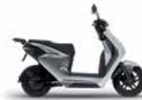
Digital Silver Metallic